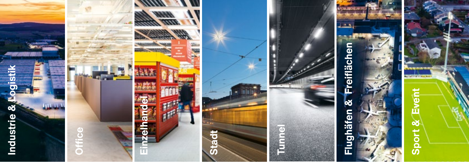
Industrie & Logistik